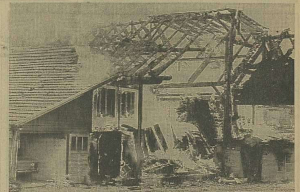
Le bâtiment entièrement détruit.

taire Rime et l'intervention des pompiers de La Tour-de-Trême fut très rapide, mais le feu fut plus rapide encore. En quelques instants, malgré les efforts des pompiers de La Tour-de-Trême appuyés par le centre de renfort de Bulle, l'immeuble n'était plus qu'un amas de poutres et de bois calcinés. Au rez-de-chaussée se trouvait l'atelier; au premier étage l'appartement des époux Rime. Le sinistre a tout détruit hormis certaines machines qui ont souffert par le feu et par l'eau. L'immeuble était taxé 108 000 francs et le propriétaire subit une perte importante. Tout le mobilier de l'appartement a été réduit en cendre. Chacun compatit à l'épreuve qui frappe M. et Mme André Rime, tournaïns de vieille souche et artisans estimés. La cause de cet incendie — on pense à un éventuel court-circuit — n'est pas encore établie et l'enquête de la Préfecture se poursuit. A. Sch.