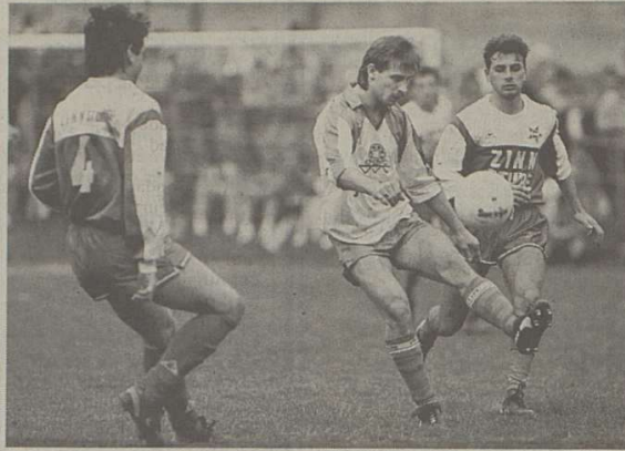
Buchli jongle entre Hartmann et le prometteur Simone. Alain Wicht