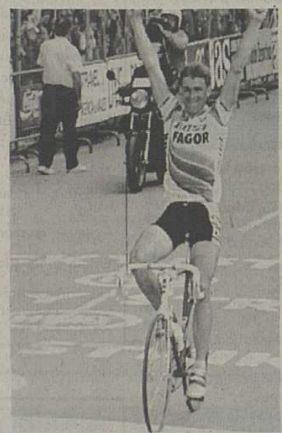
En Irlande, il n'y a pas que Kelly et Roche qui savent pédaler, à témoin Sean Yates, vainqueur à Jaca.